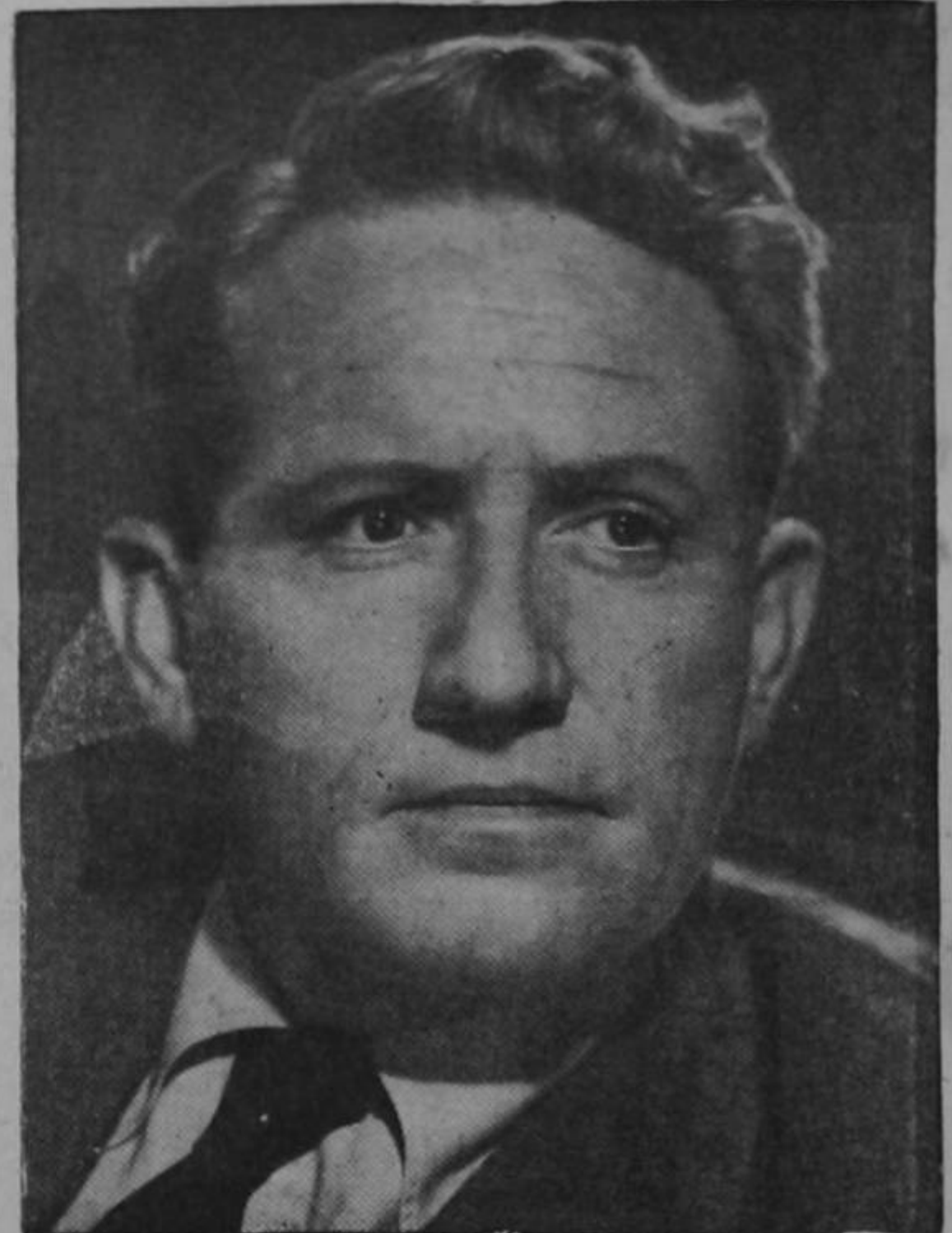
Spencer Tracy es uno de sus más severos críticos. Antes de su sonado éxito en "MAR DE HIERBA", estaba descontento con su caracterización. Próximamente aparecerá en "EL JUEZ CASS TIMBER-LANE", una nueva película de la Metro-Golwyn-Mayer.

Mostró su flexibilidad en películas biográficas tales como "EDISON EL HOMBRE", "HACI A OTROS MUNDOS" y "STANLEY Y LIVINGSTON". Cuando se trató de acción violenta y de riñas, él y Clark Gable realizaron caracterizaciones memorables en "EL FRUTO DORADO" y "PILOTO DE PRUEBAS". En "EL HOMBRE Y LA BESTIA", Tracy llevó a la pantalla un personaje completamente distinto: dramático