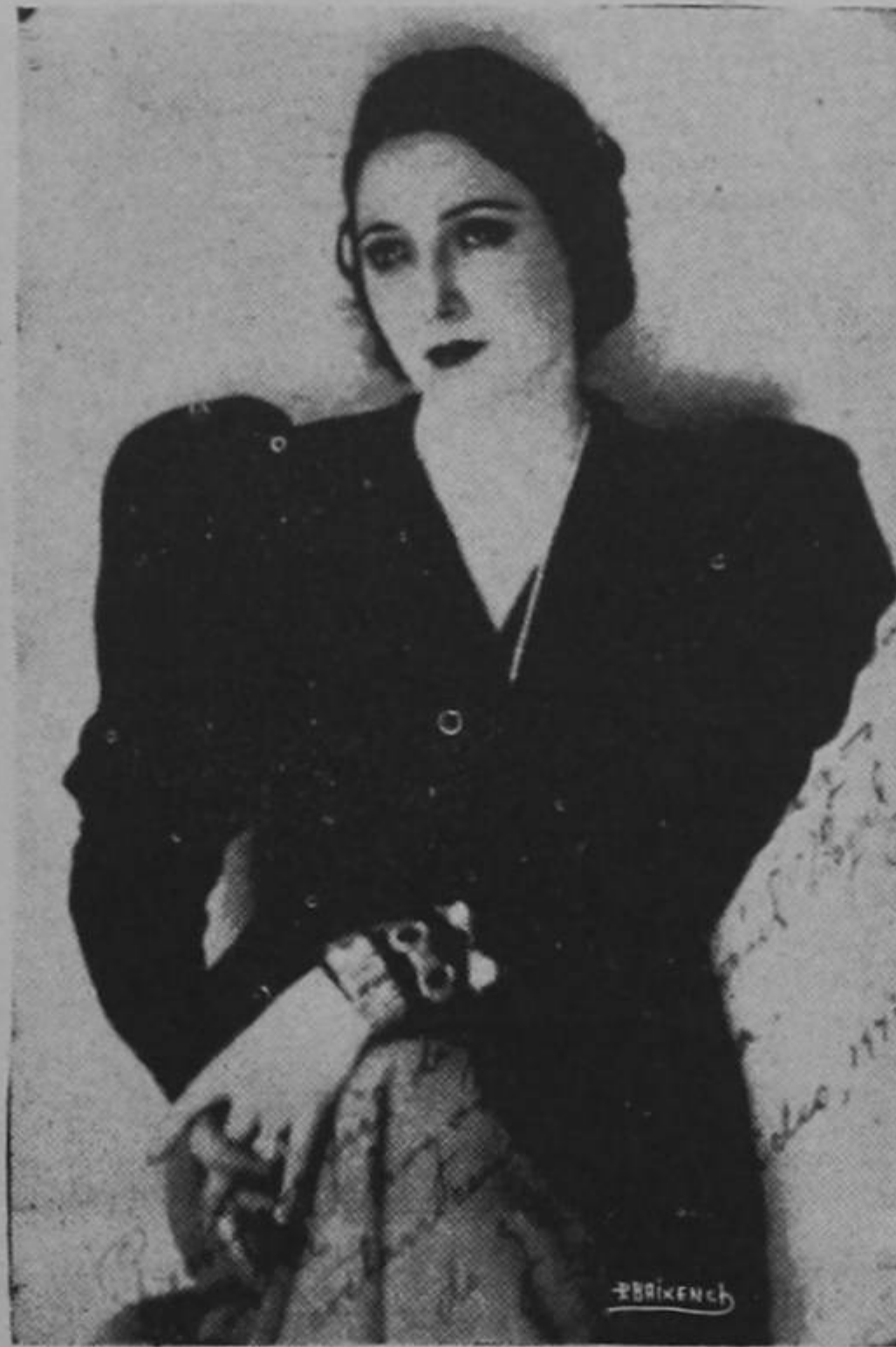
Juana de Ibarbourou (URUGUAYA)

Una comisión de todos los congresos de América presentó ante el Congreso uruguayo la petición de que se le otorgase el título de Juana de América a la excelsa poetisa Juana de Ibarbourou, y desde entonces ella ostenta gloriosamente ese título de reconocimiento.